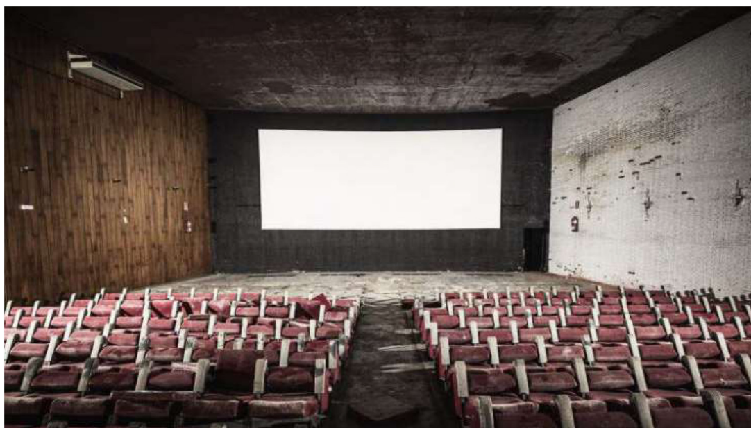
Aspecto que presenta actualmente la antigua sala de proyección del cine Rex.

Los promotores, de origen chino, prefieren no desvelar aún a qué se destinará el local, cuya reforma ha comenzado, y avanzan que donarán el valioso mural del hall PÁGINAS 8A10