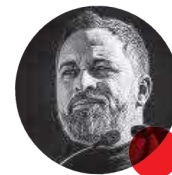
SANTIAGO ABASCAL LÍDER DE VOX